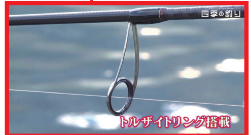
トルザイトリング搭載

Length(ft) : 7'4"・LURE(g) : 0.6-1.0・Line(lb) : 2-6・PE.Line(号) : 0.3-0.8・Action : EX. Fast・PRICE(¥) : 32,000