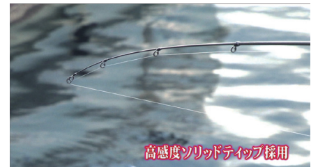
高感度ソリッドティップ採用