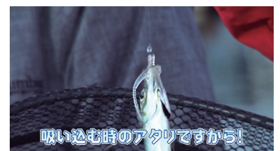
吸い込む時のアタリですから！