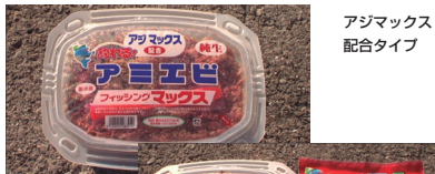
アジマックス 配合タイプ

仕掛け、ハサミ、アミエビカゴ、水汲みバケツ、軍手、タオル、レインウェア。ボックスにはこれだけの商品が入っています。初心者の方にもオススメです！